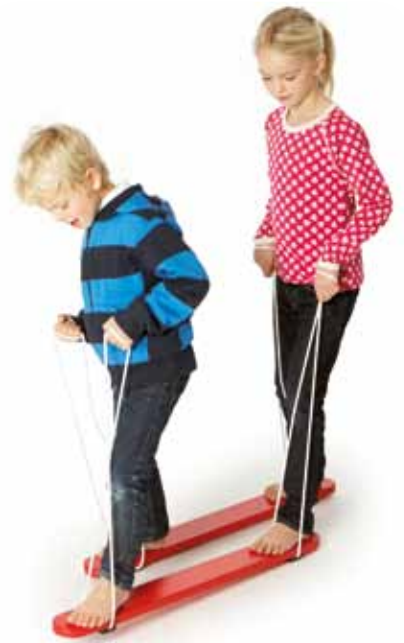
62108 Sommerski, L: 88 cm, 1 par ..... 249,-