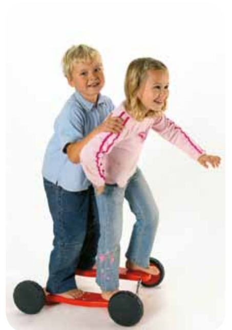
62139 Go-Go Bus, L53 cm, for 2-3 børn .. 798,-