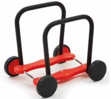
62136 Håndtag til Go-Go Bus, 2 stk. .... 490,-