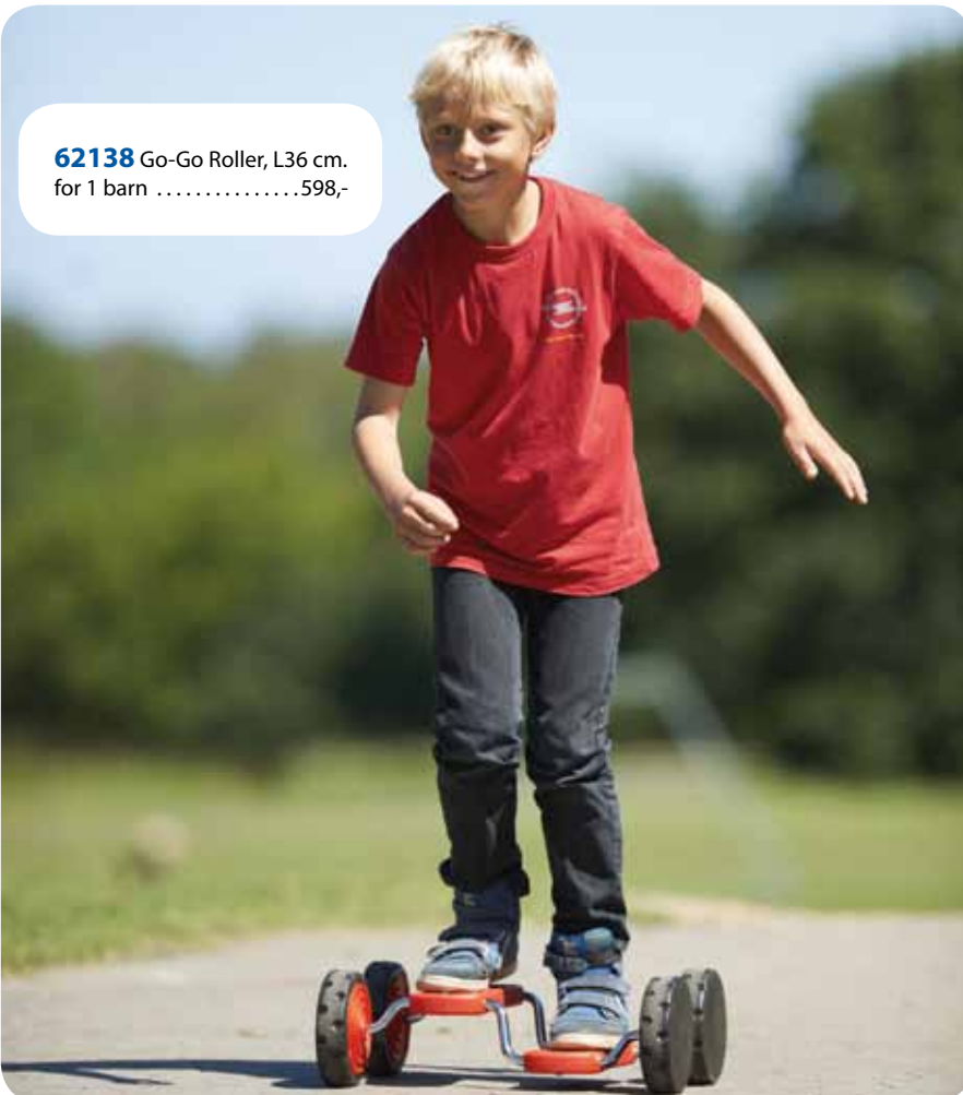
62138 Go-Go Roller, L36 cm. for 1 barn ..... 598,-